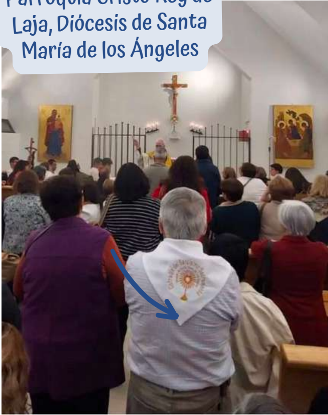
Parroquia Cristo Rey de Laja, Diócesis de Santa María de los Ángeles