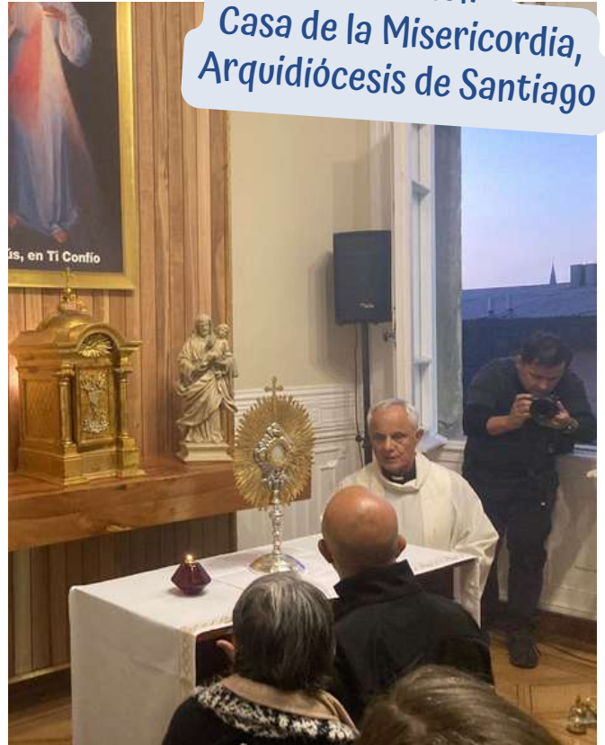
Fundación Casa de la Misericordia, Arquidiócesis de Santiago

El domingo 16 de abril, en una hermosa celebración por la Fiesta de la Divina Misericordia, fue bendecida e inaugurada la Capilla de Adoración Eucarística Permanente en la Casa de la Misericordia.